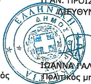
ΙΩΑΝΝΑ ΓΑΛΑΖΟΥΛΑ Πολιτικός μηχανικός