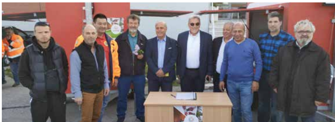
Από την παράδοση παραλαβή των πέντε συρόμενων Trailers.