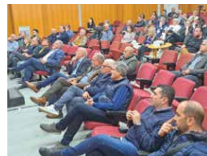
Την εκδήλωση παρακολούθησαν δεκάδες πολίτες.

μόνιμης κατοικίας, αλλά και για την ανάπτυξη επιχειρηματικής δραστηριότητας", υπογράμμισε ο δήμαρχος Θέρμης.