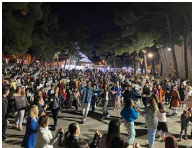
Το γλέντι το βράδυ της Πρωτομαγιάς στη Νέα Ραιδεστό.

Ο Περιφερειάρχης Κεντρικής Μακεδονίας κ. Τζιτζικώστας κατά το σύντομο χαιρετισμό του συνεχάρη όλους όσους συνέβαλαν στη διοργάνωση της εκδήλωσης και ξεκαθάρισε πως η Περιφέρεια μέσω του Κέντρου Πολιτισμού θα βρίσκεται στο πλευρό και θα στηρίζει εκδηλώσεις που αναδεικνύουν την ιστορία μας και τον Πολιτισμό μας. «Συνεχίζοντας την πολύ