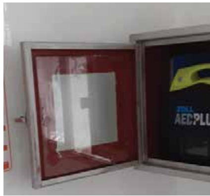
Στους 19 απινιδωτές που υπάρχουν ήδη θα προστεθούν και άλλοι 25.

Σημειώνεται ότι σε κοινότητες του δήμου Θέρμης υπάρχουν ήδη 19 απινιδωτές από διάφορες δωρεές. Συγκεκριμένα, ο Τρίλοφος διαθέτει τέσσερις απινιδωτές, τρεις η Καρδιά, από δύο τα Βασιλικά, το