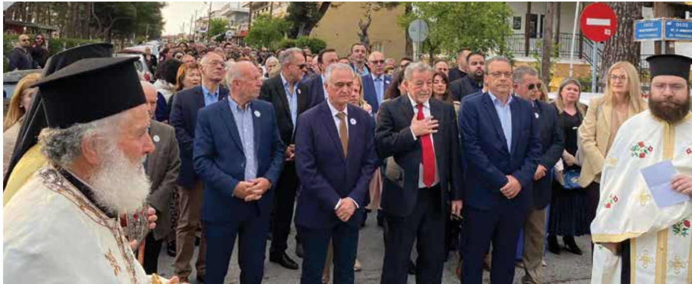
Από τη λιτανεία της εικόνας του Αγίου στη Νέα Ραιδεστό.

Σ ε κλίμα θρησκευτικής κατάνυξης και παρουσία εκατοντάδων πιστών πραγματοποιήθηκαν οι διήμερες εκδηλώσεις για τον Πολιούχο Άγιο Αθανάσιο στη Νέα Ραιδεστό και τον Τρίλοφο. Οι εκδηλώσεις ξεκίνησαν το απόγευμα της Πρωτομαγιάς με το Μέγα Εσπερινό και την περιφορά της εικόνας του Αγίου Αθανασίου και στις δύο Κοινότητες, παρουσία της δημοτικής αρχής, βουλευτών, αλλά και εκατοντάδων δημοτών που κατέκλυσαν τις εκκλησίες. Στις μουσικοχορευτικές εκδηλώσεις και το λαϊκό γλέντι που ακολούθησε στη Νέα Ραιδεστό, στον αύλειο χώρο του 1ου και 2ου Νηπιαγωγείου ο δήμαρχος Θέρμης Θεόδωρος Παπαδόπουλος υποδέχτηκε πενταμελή αντιπροσωπεία του Δήμου Τεκίρνταγ Μπουγιουκσεχίρ (Ραιδεστός) καθώς και μελών του Συλλόγου Θεσσαλονίκης του χωριού Ισικλάρ (Σχολάρι) από τη γειτονική Τουρκία. Να σημειωθεί πως στο δήμο Τεκίρνταγ Μπουγιουκσεχίρ (Ραιδεστός) έχουν τις ρίζες τους οι κάτοικοι των οικισμών Ν. Ραιδεστού και Κ. Σχολαρίου και είναι η δεύτερη φορά που εκπρόσωποι από αυτές τις περιοχές τιμούν με την παρουσία τους τις εκδηλώσεις για τον Πολιούχο Άγιο Αθανάσιο στη Νέα Ραιδεστό.