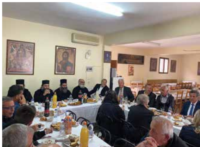
Από τον εορτασμό του Αγίου Αθανασίου στον Τρίλοφο.

καλή συνεργασία μας με το δήμαρχο Θέρμης Θεόδωρο Παπαδόπουλο θα συνεχίζουμε να προσφέρουμε στον Πολιτισμό που βρίσκεται ψηλά στην ατζέντα των προτεραιοτήτων μας αλλά και με την υλοποίηση μεγάλων έργων που θα συμβάλουν στην αναβάθμιση του όμορφου τόπου σας» σημείωσε με έμφαση ο κ. Τζιτζικώστας. Στις εκδηλώσεις παρέστησαν επίσης οι βουλευτές Σάββας Αναστασιάδης, Σωκράτης Φάμελλος και Δώρα Αυγέρη.