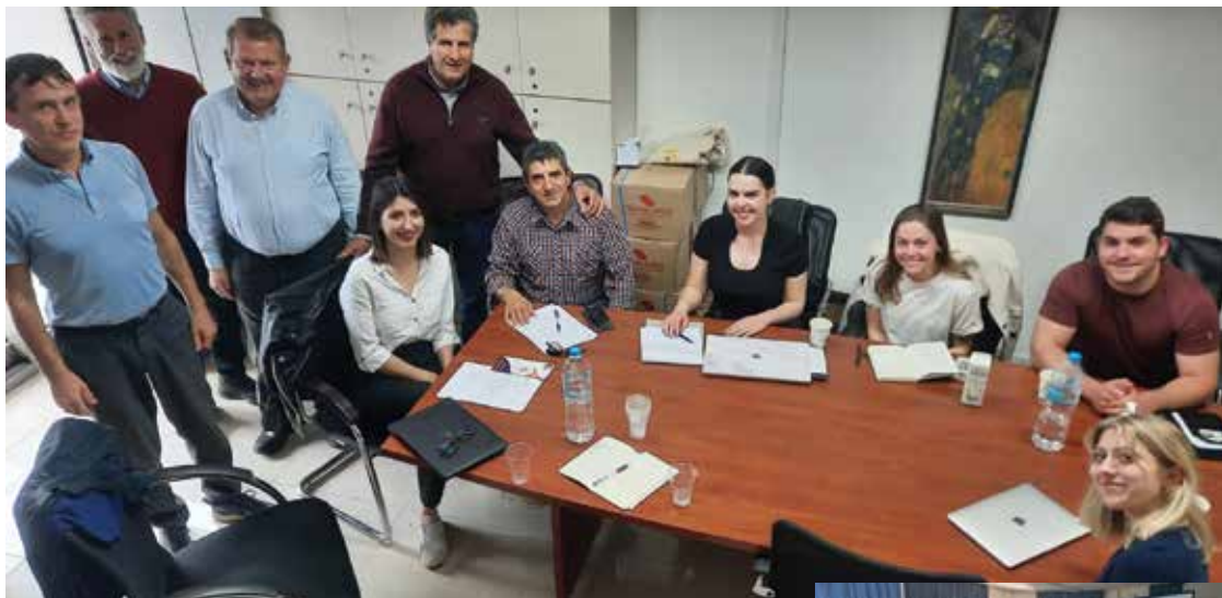
ΤΗΣ ΣΥΝΕΡΓΑΣΙΑ ΤΟΥ ΣΥΜΒΟΥΛΙΟΥ ΝΕΩΝ ΔΗΜΟΥ ΘΕΡΜΗΣ ΜΕ ΤΟ ΠΑΝΕΠΙΣΤΗΜΙΟ WPI