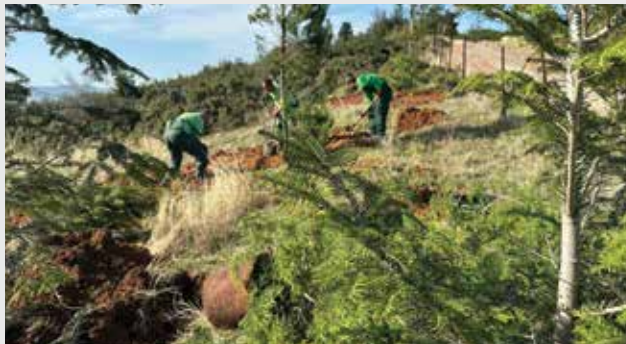
Το ελατοδάσος είναι στην περιοχή του Τριάδιου.