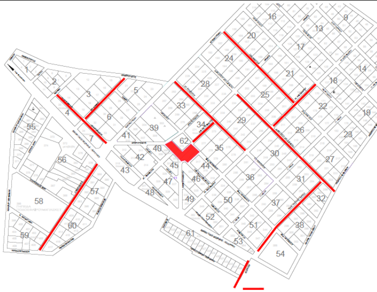
NEA PAIDESTOS: Προϋπολογισμός: €340.000