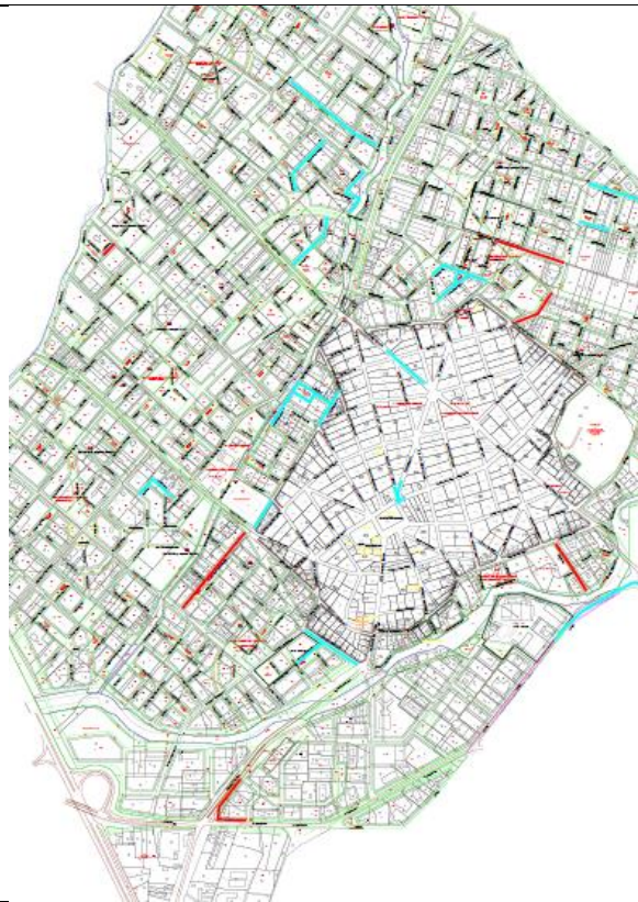
ΘΕΡΜΗ: Προϋπολογισμός: €780.000