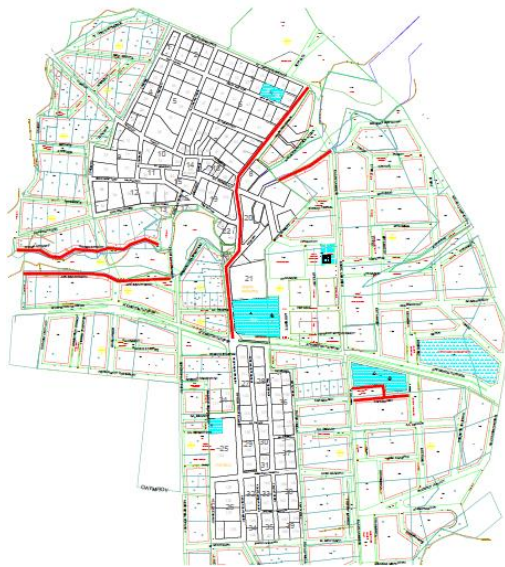
ΤΡΙΑΔΙ: Προϋπολογισμός: €140.000