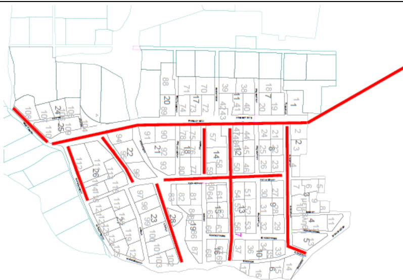
TAGARADES: Προϋπολογισμός: €270.000